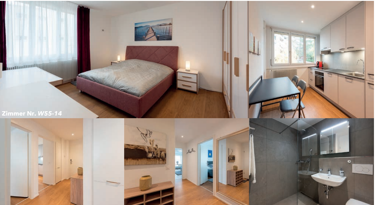
Zimmer Nr. W55-14

Wir bieten ein stilvoll eingerichtetes Zimmer in einer modernen 3-Personen-WG. Die Möbel sind komplett neu und umfassen ein komfortables Doppelbett, einen geräumigen Kleiderschrank, Kommode, einen Schreibtisch, einen Stuhl und einen gemütlichen Sessel, Gardinen und Beleuchtung.